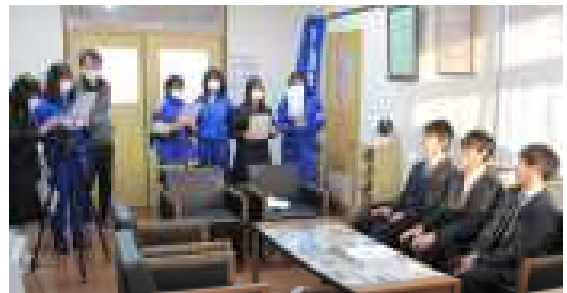
校長室での撮影風景

今年度も57名の人権委員が12月10日の『人権のつどい』に向けて準備を進めています。表題のテーマは二人の2年生の意見をもとに考えられました。各学級では1・2学期に取り組んだ人権学習で学んだことをもとに作文や標語にまとめ、学級の人権宣言を考えました。また、内容や脚本も生徒が自分たちで考えた2本の動画の制作を行っています。1つは身近な学校生活の中から題材を取り上げ、もう1つは社会問題にもなっている題材を取り上げ、撮影や演出も生徒が互いに声を掛け合いながら進めました。また、人権のつどいの運営について考え、全校の意見を集約した『甲西中人権宣言2021』の作成も進めています。