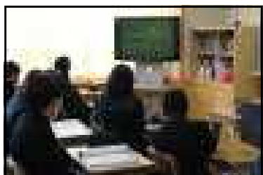
（テレビ画面に集中する生徒たち）

教室にいた生徒たちはテレビ画面を見ながら、各担当からの話をしっかりと聴いていました。生徒一人ひとりにとって中身の濃い有意義な3学期になることを願っています。