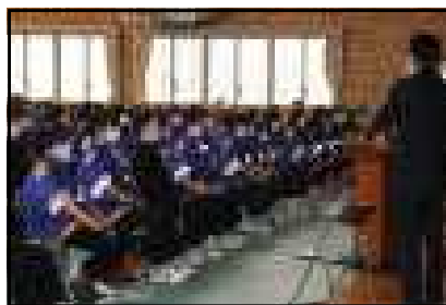
(説明と聴く生徒たち)

12月24日(木)、高校の先生にご来校いただき「マナー講座&進路学習会」を開催しました。マナー講座では、あいさつやお辞儀、名刺交換の仕方やしなみ等について教えていただきました。実際にあいさつの仕方を全員で練習しました。その他、敬語や丁寧な言葉遣い、さらに最後までやり遂げることが大切であると熱心にご指導いただきました。休憩を挟んで、学校紹介をしていただき各コースの特徴やさまざまな資格が取得できることを学びました。今後の進路選択の参考となることを願っています。寒い中、ご講演をいただきました講師の先生、さらに保護者のみなさま、ありがとうございました。