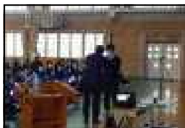
(名刺交換の手本と紹介)