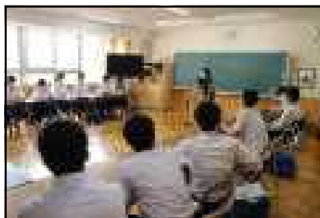
(生徒会本部の様子)

1年生にとって初めてとなる生徒会活動。学級討議や生徒総会を控えて、各委員会において年間活動計画や学級討議の中で説明する内容等を検討しました。委員長からの説明を受けて質疑を行ったり、担当の先生からの補足説明や委員会活動の大切さ等の話があったりしました。今後は、6月26日の生徒総会に向けて急ピッチで準備を進めていく予定です。よりよい学校生活の一助となり生徒会活動がより活性化されるよう今後の活動に期待しています。