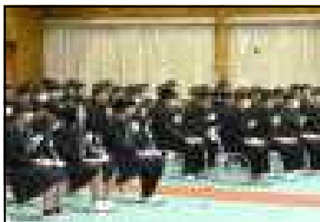
(卒業証書と手にした卒業生)

力強く71期生が羽ばたいていきました。新型コロナウイルス感染症拡大防止のため、規模を縮小して実施した本校卒業式。卒業証書授与は一人ずつしたい、時間短縮も図りたいといった課題を克服するため、今年度は対面形式で実施しました。2週間ぶりの学校、友との出会い、練習なしの卒業式本番等、和やかな中に緊張感が交差する体育館。最後の校歌斉唱、そして卒業生旅立ちのことば。自らの手で立派に卒業式を創りあげることができました。卒業生の皆さん、おめでとう。保護者の皆様、おめでとうございます。心よりお祝い申し上げます。