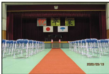
(準備万端 卒業式会場)

明日、3月14日は71期生の卒業式です。新型コロナウイルス感染症拡大防止のため、一斉臨時休業となりましたが、卒業式は何とか実施できることとなりました。しかしながら、規模縮小は避けることができず、 来賓の皆様にはご遠慮いただき、在校生も参加できません。また、保護者は2名以内の参加とし、入場制限を行います。小さな子どもさん等も入れません。 感染防止対策ということでご理解をいただき、適切に対応くださるようお願いいたします。さて、式場準備が整い、明日の本番を迎えるのみとなりました。開式時間を30分繰り下げ、10時00分開式となります。例年とは少し