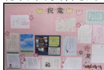
(多くの祝福とエールが!)

違った雰囲気での卒業式となりますが、卒業生を祝福する思いに何も変わりはありません。厳粛な卒業式となりますように…。